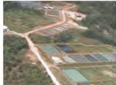
Basins de la Station INRA-IFREMER de Soucoumarie.