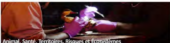
Animal, Santé, Territoires, Risques et Écosystèmes

Microbiologie • biologie cellulaire • épidémiologie • entomologie • virologie • séquençage • bioinformatique • génomique • transcriptomique et protéomique • modélisation • coordination de réseaux • coordination de projets européens • expertise sur la coopération régionale • expertise en système qualité et accréditation • expertise en laboratoire d'analyse et de recherche.