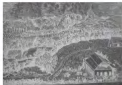
Vue aérienne du Centre en 1949.