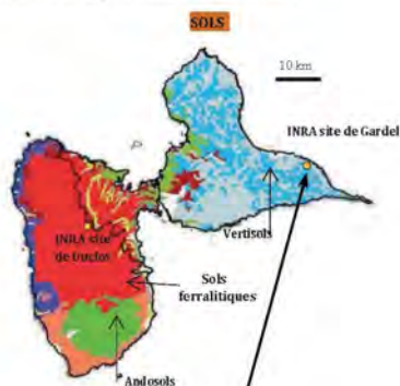
PTEA - Site de Gardel Grande-Terre – LE MOULE

Plateau calcaire, vertisols à argiles gonflantes. Zone sèche : pluviométrie de 800 à 1200 mm. Surface exploitée : 50 ha de prairies