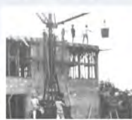
Construction du laboratoire de Biologie végétale dit «Grand Labo».

Extraits de : «Centre de Recherches Agronomiques des Antilles françaises» par Henri STEHLÉ. Bulletin Mensuel d'Information - Commission Caraïbe du 01/12/1954.