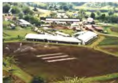
Vue aérienne du Centre en 1999.