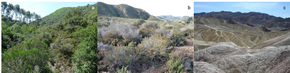
Photo 1. Selon une nouvelle étude parue dans Science, les paysages verdoyants de la moitié sud de la France pourraient se transformer en montagnes désertiques d'ici à 2100?

Selon les projections climatiques d'un scénario « business as usual 1 », plus de 20% des terres émergées de la planète pourraient franchir un ou plusieurs des seuils identifiés par cette étude d'ici 2100 en raison du changement climatique (carte ci-dessous). La vie ne disparaîtra pas des zones arides, mais ces résultats suggèrent que les écosystèmes de notre planète connaîtront des changements brusques qui affecteront directement plus de 2 milliards de personnes vivant actuellement en zone aride mais aussi au-delà. Ainsi l'étude montre que le bassin méditerranéen dont la moitié-sud de la France pourrait être particulièrement touché par ces phénomènes, modifiant radicalement les paysages que nous connaissons.